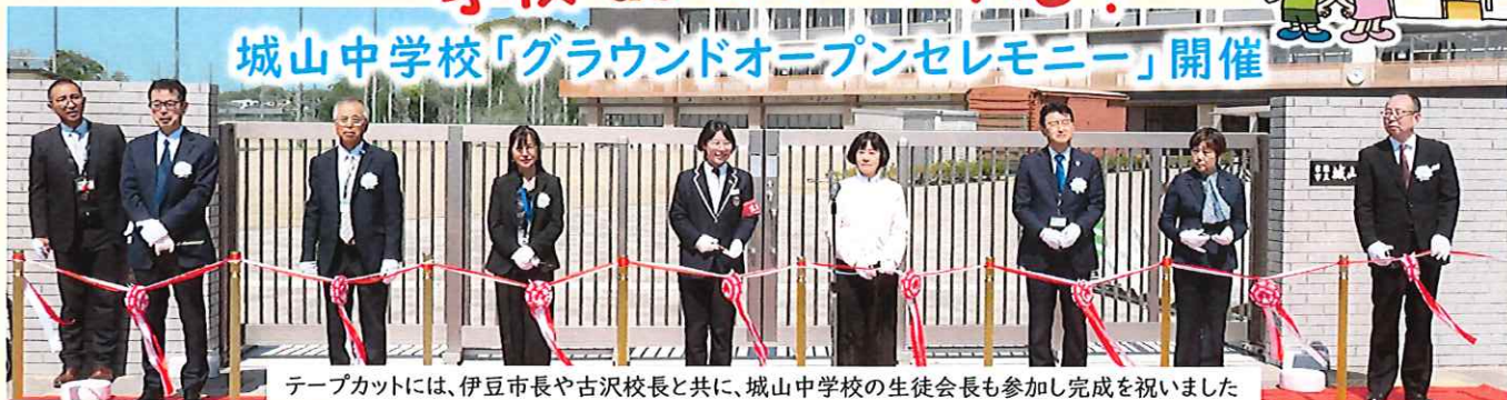
テープカットには、伊豆市長や古沢校長と共に、城山中学校の生徒会長も参加し完成を祝いました

令和2年からスタートした城山中学校改築事業がグラウンド整備も含めて令和7年度末にすべて完了し、4月7日(火)の始業式終了後にセレモニーが行われました。