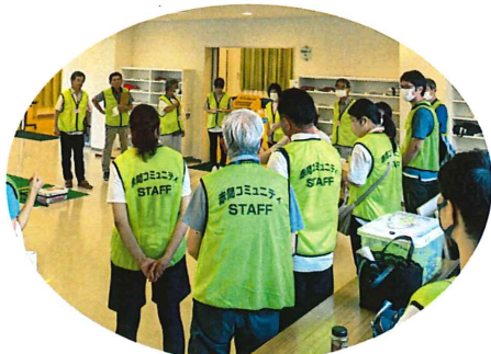
各地区の公民館長をはじめ、部会員全員が審判員などのサポートを行いました

公民館活動部会では、7月21日(日)にニュースポーツ大会を赤間コミセンで開催しました。 本大会は、世代間交流、地域間交流と併せてニュースポーツの普及を目的とし、毎年行っています。 今年度は、各地区から14チーム計95人の参加者が大会に挑みました。 競技種目は、穴の開いたボードにお手玉のような布製バッグを入れる「バツゴウ」、パットゴルフの要領で点数が書いてある穴へ球を狙い入れる「スカットボール」、倒してもピンが回転し取りに行かなくていい「ピンボウリング」、そして点数が書いてある的へ球を当てる「ターゲットゲーム」の4種類でした。