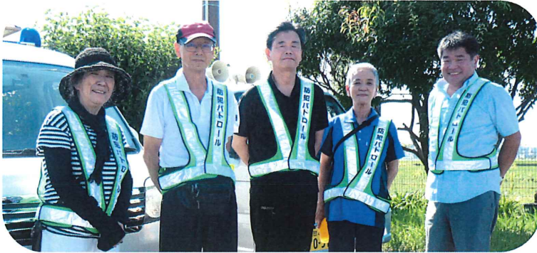
この日のパトロール隊は5人。2台の青パトで地域の見守り活動を行いました

また、小・中学生の下校時に安全確保の見守りとして青パトで巡回しています。パトロールをしてい