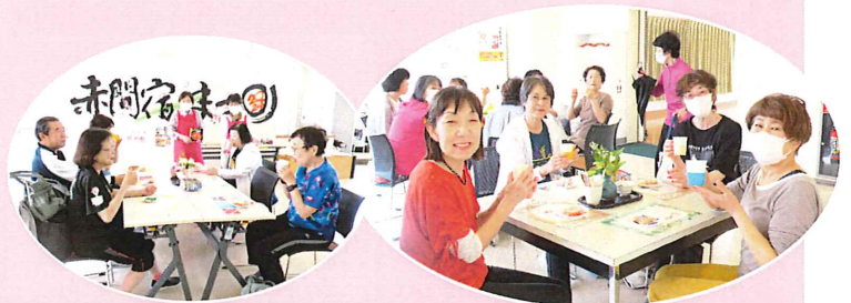
おけいこ事の後に楽しむ様子。会話が弾みます♪