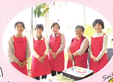
TMA会の皆さんが笑顔でお迎え