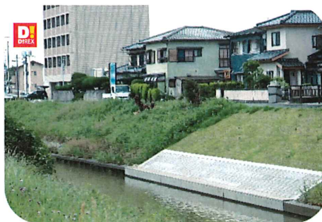
改修後の土手(徳重桜公園から石丸方面に向かう釣川沿い)