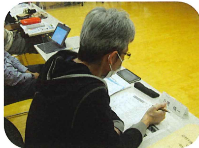
区長会の訓練の様子