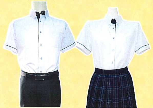
夏服バージョン(半袖シャツ)

※宗像市では小中一貫の浸透を図るため、令和4年度から中学1,2,3年生の呼び方を7,8,9年生と呼びます。