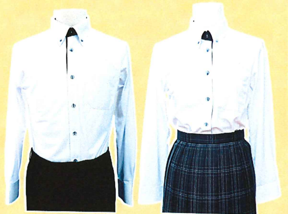
春秋バージョン(長袖シャツ)