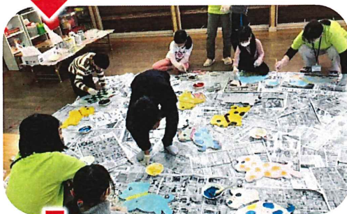
仕上げ(学童保育所)