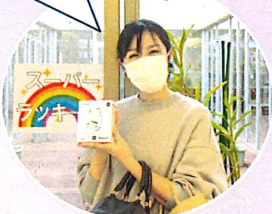
この日のスーパーラッキーさん

子どもがクリスマスに欲しいと言っていたワイヤレスイヤホンが当たりました! うれしいです♪