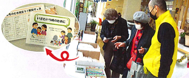
来場者プレゼントで防災の啓発