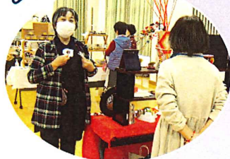
商品を選ぶのも楽しい

子どもがクリスマスに欲しいと言っていたワイヤレスイヤホンが当たりました! うれしいです♪