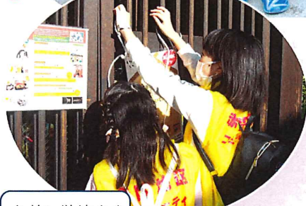
名前と学校名を書いてください