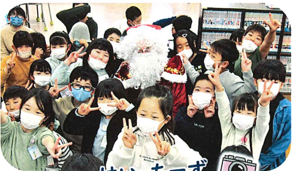
サンタさんとはい、ちーず

赤間地区コミュニティが学童保育を運営し始めて4年。シニアクラブや民生委員の皆さんに毎回お願いしてサンタさんになっていただいています。地域の方々と子どもたちとの出会いをもっと作っていきたいと思います。(杉)