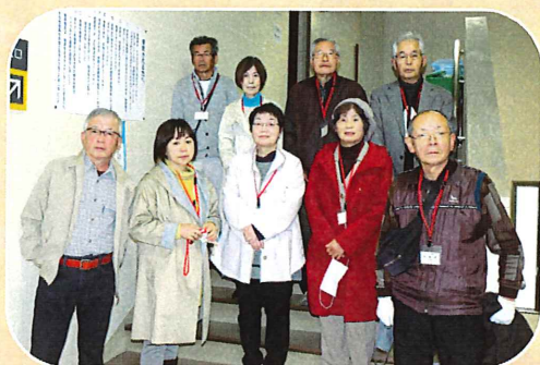
本会議場の入り口 (撮影の時のみマスクを外しています)

男女共同参画部会では、昨年度に続いて市議会の視察に行きました。当日は、本会議場で一般質問が行われていました。各議員の市政に対する姿勢や人柄が、よくわかる場面ですが、全議員20人の質問を見学するには4日の日数がかかります。そこで利用していただきたいのが、宗像市のホームページです。市議会のページに本会議や各委員会の映像が、生中継と録画放送で配信されています。