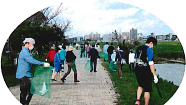
さくさんの方にご参加いただきました