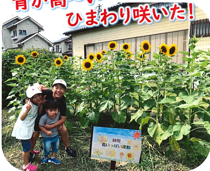
緑町公民館の前(撮影の時のみマスクを外しています)