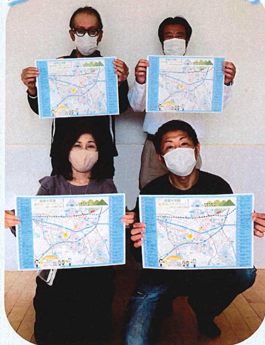
車を運転する人も、ぜひ活用してください

青少年育成部会の子ども見守り推進事業の一環として「赤間小学校通学路ハザードマップ」を作成しました。 「不幸な事故を無くしたい」という思いで作成を始めたこのマップ。 昨年度、青少年育成部会員に、自分の自治区を調査してもらい、さらには赤間小学校PTAの皆さんから集めた情報を合体させ作成したものです。 子どもたちにとって危険な場所は、大人も気を付けないと危ない場所だと思います。 このマップは子どもた