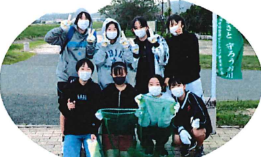
城山中学校の生徒も参加

本年は釣川流域だけではなく、その周辺区域も合わせてきれいにしようという思いを込め、タイトルも新たに「赤間地区」を頭に加えた赤間地区釣川クリーン作戦を実施しました。 昨年はコロナ禍で実施できなかったため、2年ぶりの実施となりましたが、懸念していた雨も止み、総勢485人の皆さんにご参加いただけました。