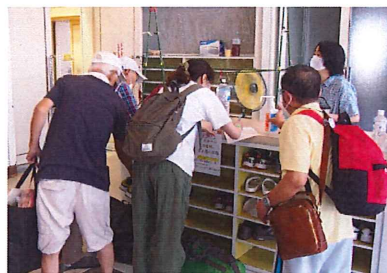
赤間小学校の避難所の様子

食料は持参しましょう。また、今回の台風では、緑町や葉山など、宗像市の一部の地域で6日の夜から7日の昼前まで停電がありました。 いざという時に慌てないように、日頃から備えておきましょう。(事務局)