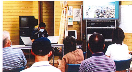
実例を見ながらわかりやすく説明

例年ならば宗像市全体で防災訓練が実施されますが、今年はコロナ禍のため、各自治区での自主防災訓練を行うことになりました。