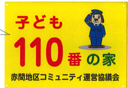
「子ども110番の家」看板