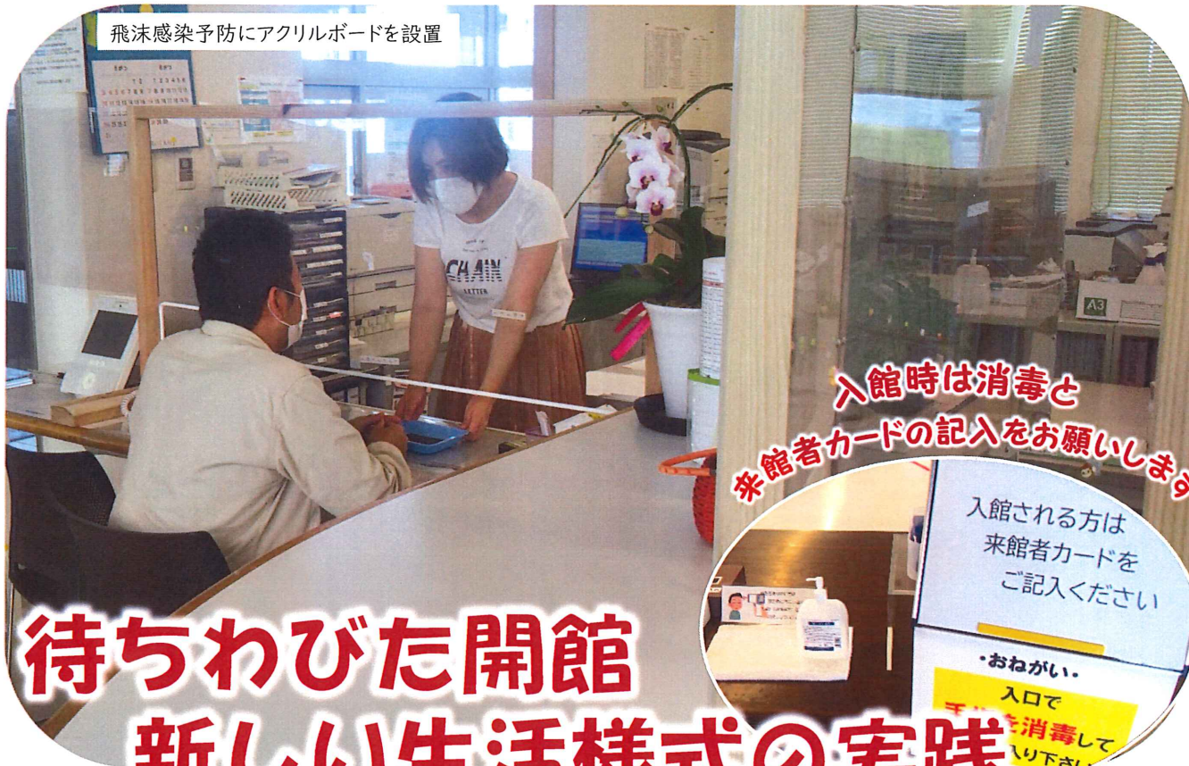
飛沫感染予防にアクリルボードを設置