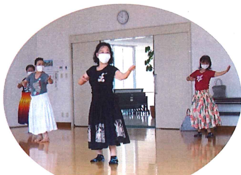
距離を保ってフラダンスの練習

6月2日(火)、コミュニティ・センターを約2カ月ぶりに開館しました。新型コロナウイルス拡大予防のため、来館される方にはマスクの着用、手指の消毒、利用人数の制限などを呼びかけ、3密防止に皆さまのご理解とご協力をいただきながら運営しています。