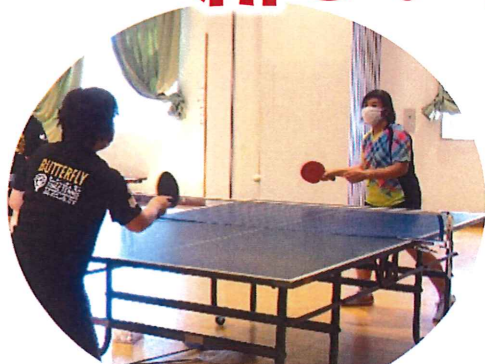
運動中もマスクを着用