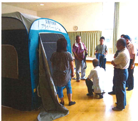
防災士がテントの組み立て方を説明