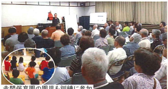
赤間保育園の園児も訓練に参加

宗像市を震源とする地震が発生し、避難勧告が発令されたとの想定で防災訓練が実施されました。 指定された避難場所の赤間公民館には、赤間区連絡網により区民が続々と詰め掛け、総勢131人が訓練に参加しました。 「自分や家族がいる位置を、大雨・土砂・地震・津波の災害別に判断し て避難すること」それは宗像市が配布している防災マップがいかにかに大切かを、防災士の講義で痛感しました。