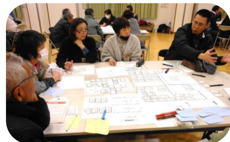
グループごとに気付いた事や問題点を真剣に話し合う

参加者は各テーブルに分かれ、机の上には仮想の体育館と校舎の図面が広げられ、避難所運営開始です。まず、避難者にストレスがかからないように、非常用の通路を設け収容しましたが、皆さんは初めての体験で、ニックになりました。避難してくる方には高齢者、妊産婦、障害者、ペットの犬猫を連れて避難してくる方々を体育館と校舎に振り分ける作業を体験しました。なかでもトイレ問題にはどのチームも悩みました。このように普段では想像できないことを体験できたことは、災害時に何らかの役に立つのだと思います。課題もたくさん見つかりました。参加者からは、実際に被災者を受け入れてみて初めて知ったこともあり、かなりのエネルギーを使うことが分かったとの感想がありました。特に災害時には女性の視点を取り入れなければならぬことが多く見つけられ、責任の重さを感じました。(真嶋)