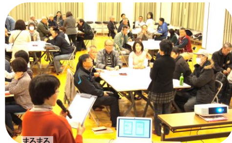
まるまる 〇〇すけったーず先導のもと、被災所運営ゲーム(HUG)を使って避難所体験