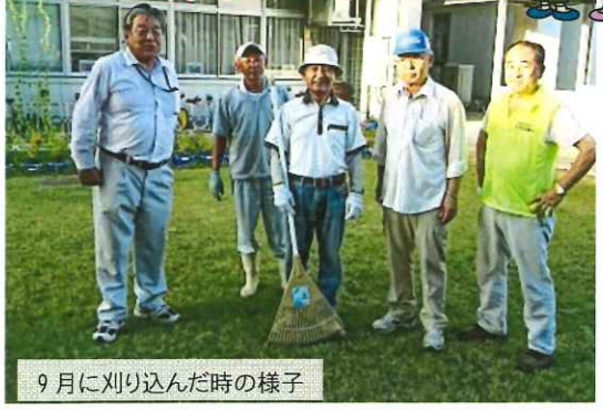
9月に刈り込んだ時の様子