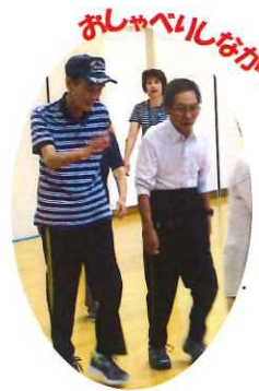
おしゃべりしながら