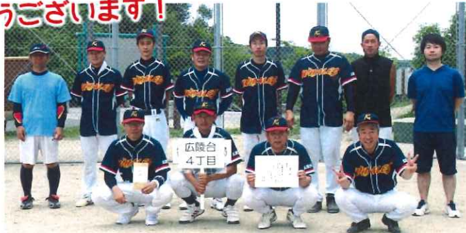
広陵台4丁目チーム