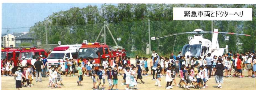
緊急車両とドクターヘリ

赤間地区の防災士7人の指導の下に、18自治会から参加された役員36人が一緒に防災用品の避難所ボード、プライベートルーム、エアベッド、トイレの組み立てや収納の練習を行いました。一通りの訓練の後には全員が防災用品に触れる時間があり、皆さん組み立てよりも収納が難しいと感じていたようです。