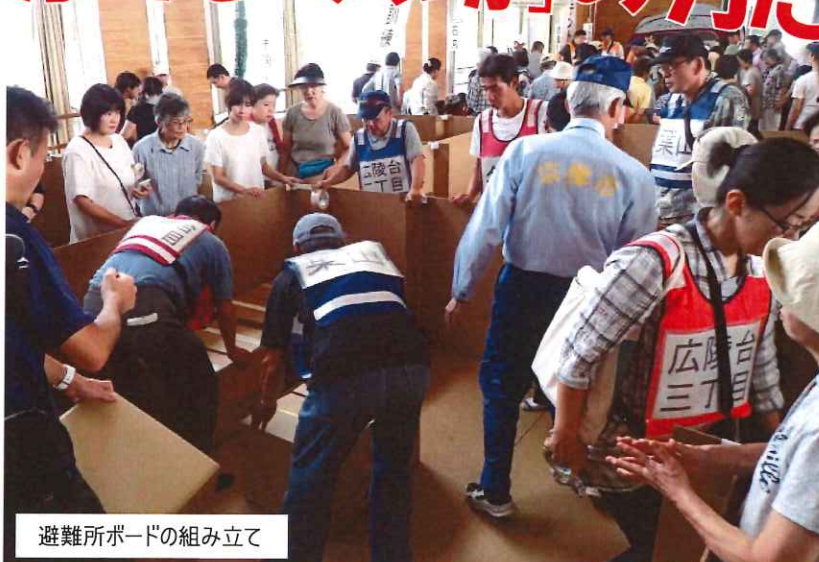
避難所ボードの組み立て

赤間地区にある三つの指定避難所(赤間コミュニティ、赤間小学校、城山中学校)に避難した訓練参加者が、赤間小学校に集合するといふものです。