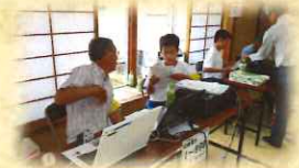
健康測定会のお手伝い