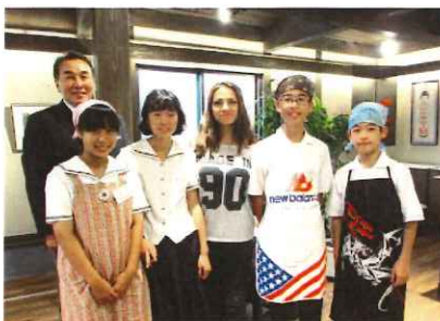
バラの女王ヨアナさんと一緒に