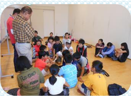
大会2週間前、子どもリーダーと5・6年生の参加者による代表者会議