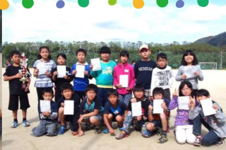
3・4年生の部優勝 Gチーム