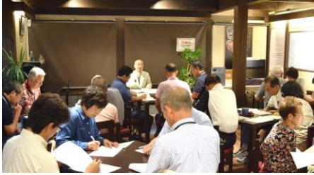
第1回目「歴史講座」の様子