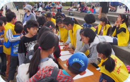
当日の受付は、子どもリーダーにまかせて！

青少年育成部会主催でドッジボール大会を行いました。青少年育成部会の子どものリーダー育成事業、今年はこのドッジボール大会の成功を目標に取り組みを行ってきました。 赤間小学校の全児童を対象とするドッジボール大会、昨年よりも多くの子どもたちの参加により今年も1・2年生チーム、3・4年生チーム、5・6年生チームと3パートによる開催となりました。 子どもリーダーたちによる大会計画、運営、子どもリーダーが中心となり大会が行われ、グラウンドでは選手の一生懸命な姿、大きな声、楽しくドッジボールをする様子が子どもリーダーたちには達成感と感じてくれたことと思います。 保護者の皆様、関係者の皆様、青少年育成部会事業にご理解とご協力、ありがとうございます。たくさんの人たちにより部会事業が成り立っていると感謝しております。 今年子どもリーダー育成事業が1月の「わくわく体験報告会」で報告ができるよう考えています。 (青少年育成部会 山下)