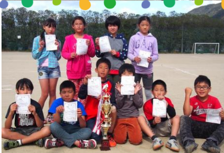
5・6年生の部優勝 Cチーム