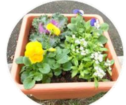
ハボタン、パンジー、ビオラ アリッサムの寄せ植え

土壌づくりと花の性質に合わせた土作りと施肥であれば、草花は何事もなかったかのよう に花を咲かせ、癒してくれま す。 (田久 高原)