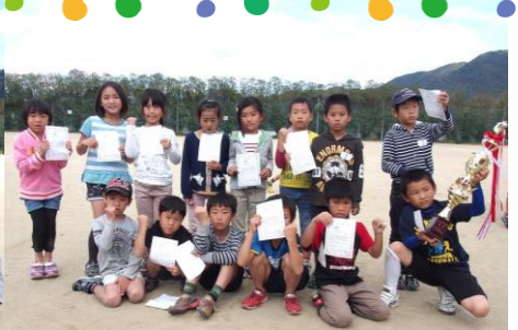
1・2年生の部優勝 Iチーム