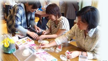
プリザーブドフラワー体験