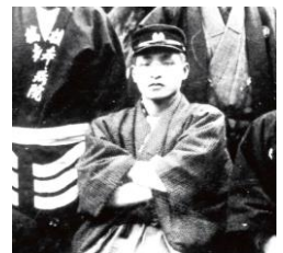
福岡商業学校時代