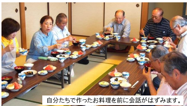
自分たちで作ったお料理を前に会話がはずみます。