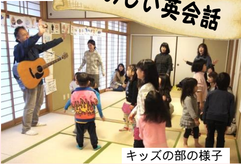
キッズの部の様子