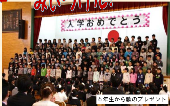
6年生から歌のプレゼント