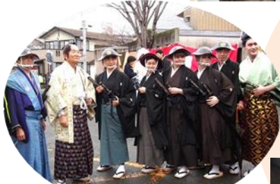
五卿に扮するは 海外からの留学生