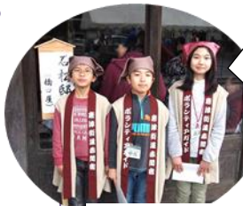
ジュニアボランティアガイド

あいにくの雨模様で始まった「赤間宿まつり」。しかし、笑顔いっぱいの花嫁行列や元気いっぱいのイベントで雨も吹き飛ばしてしまいました。宗像市内外からも大勢ご来場いただき、今年も大盛況でした。