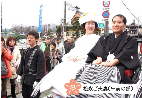
松永ご夫妻(午前の部)