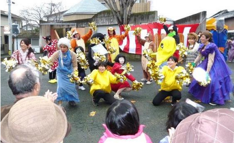
赤間保育園の先生たちによるゆかいなダンス