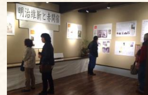
展示コーナーで歴史のお勉強