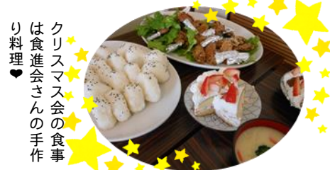
クリスマス会の食事は食進会さんの手作り料理♥

赤間小学校高学年を対象に募集をかけ、1年間を通して行っている子どもリーダー育成事業。12月7日に、今年度最後の事業「クリスマス会&認定修了式」を行いました。6月の宿泊研修に始まり、今回の認定修了式までさまざまな体験をリーダーの子もたちは経験しました。今年は特に、ドッジボール大会を盛り上げようと、子どもたちの話し合いも数多く行いました。今後もしっかりお願いいたします。(青少年育成部会 山下)