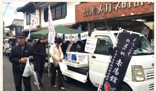
宗像全域からおいしいものが集結