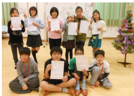
認定証を手にハイポーズ! 頑張ったね

赤間小学校高学年を対象に募集をかけ、1年間を通して行っている子どもリーダー育成事業。12月7日に、今年度最後の事業「クリスマス会&認定修了式」を行いました。6月の宿泊研修に始まり、今回の認定修了式までさまざまな体験をリーダーの子もたちは経験しました。今年は特に、ドッジボール大会を盛り上げようと、子どもたちの話し合いも数多く行いました。今後もしっかりお願いいたします。(青少年育成部会 山下)