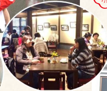
落ち着いた雰囲気のサロンで楽しいひととき