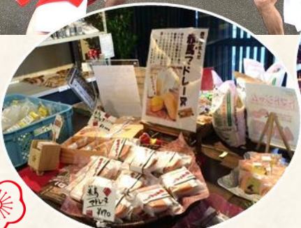
宗像の特産品がいっぱいおみやげにどうぞ♪