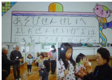
後日子どもたちから届いたお礼の手紙

赤間地区老人クラブ連合会は、赤間小学校1年生の生活科学習として「むかしあそびをたのしもう」を学校と