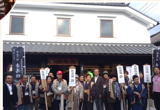
私たちガイドがご案内します!

赤馬館のサロンでは、日替わり(月曜休館)で8団体が喫茶でおもてなしをしています。また、月に2回の郷土料理「きぬがさ御膳の日」もありますので、今後ご紹介していきます!