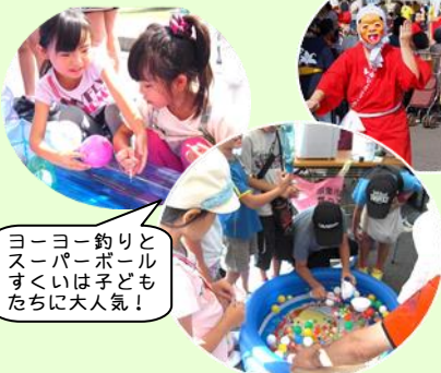
ヨーヨー釣り とスーパーボール すくいは子ども たちに大人気！