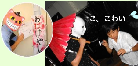
福教大生プレゼンツ、大人気のおばけやしき！