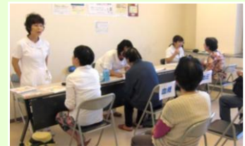
↑ 毎年恒例、赤間病院の「血圧・血糖の無料測定」コーナー