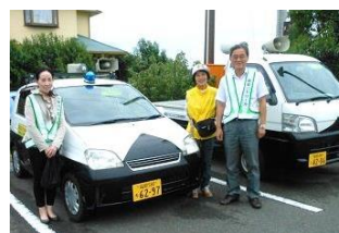
パトロール出発前にパチリ！

皆さんは、赤間地区コミュニティの「青パト」をご存知ですか？ 「青パト」とは、車に青色回転灯をつけて、地区内を巡回する防犯パトロールのことです。 平成26年10月現在、月一回の市内一斉パトロールのほか、水曜と土曜はコミュニティが地区内を回り、火曜と木曜は葉山区が、金曜は石丸区がそれぞれの 自治区を中心にパトロールしています。 この活動は、小学生の下校時の見守りや地域住民の安全安心な生活と住みよい街づくりを目的に行われています。