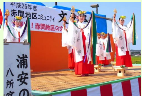
吉武地区から八所宮お神楽クラブの「浦安の舞」