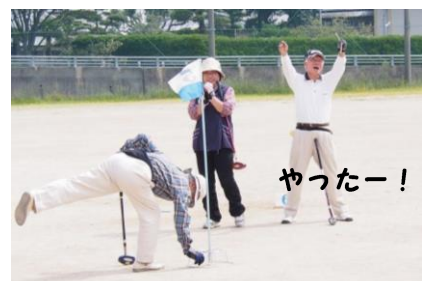
ショットが決まり喜ぶ三郎丸団地Aチーム

秋晴れの下、城山中学校グラウンドで親善交流グラウンドゴルフ大会を盛大に開催しました。