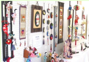
すてきな作品が並ぶ 作品展示コーナー←