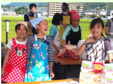
子どもリーダーのカレーいかがですか～