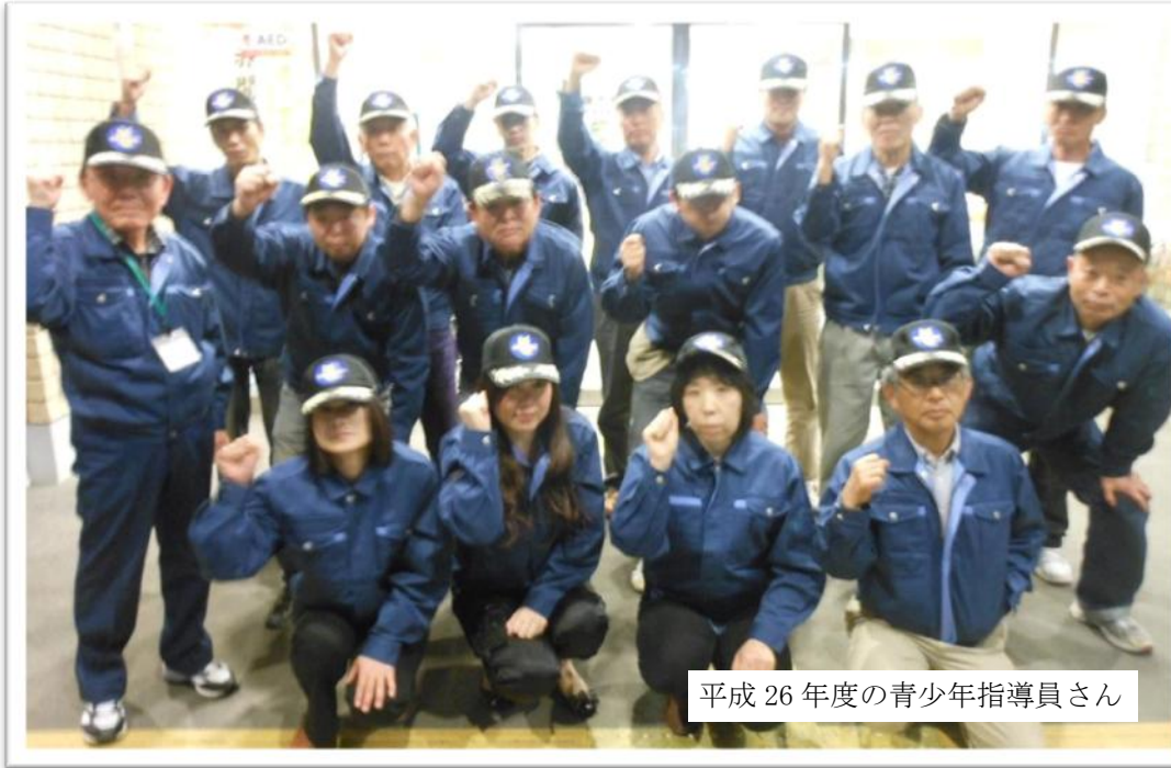
平成 26 年度の青少年指導員さん

赤間地区コミュニティの青少年指導員会は、各自治区長の推薦 18 人および中学校の校長から任命された教職員 2 人の計 20 人で活動しています。