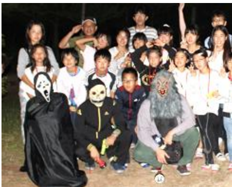
ジュニアリーダーキャンプではお化けに変身！