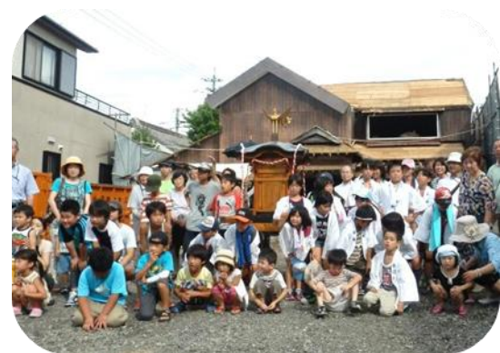
赤間子ども神輿のみなさんと一緒に

この古民家は、江戸時代には数多く軒を連ねていた兜づくりの町家ですが、現在では赤間宿に4棟しか残っていない内の一つで、元は呉服屋だったそうです。