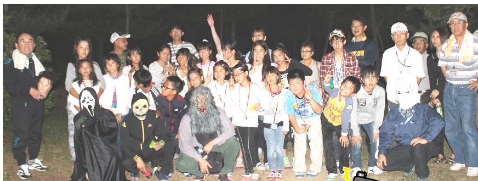
お化けと一緒にハイポーズ