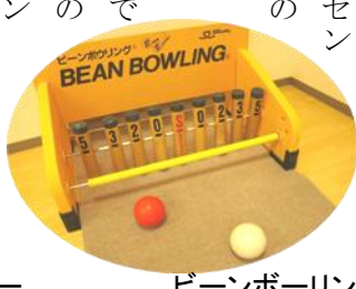
ビーンボーリング