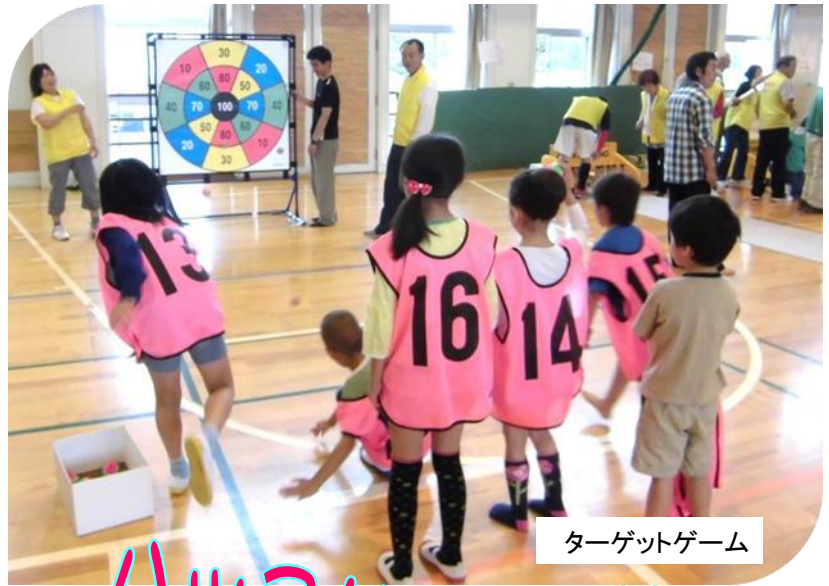
ターゲットゲーム