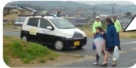
入学式に向かう親子に「いってらっしゃい」