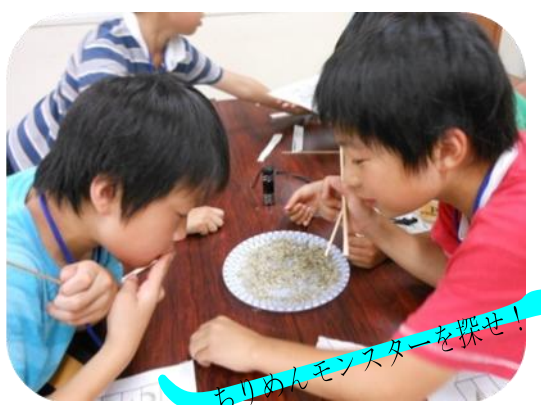
ちりめんモンスターを探せ!