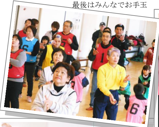
最後はみんなでお手玉