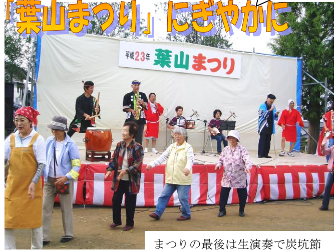
まつりの最後は生演奏で炭坑節

10月16日、葉山区で恒例の「葉山まつり」が開かれました。今年は数えて9回目。舞台の出演者などを加え、約500人の人出でにぎわいました。これは葉山区の世帯数とほぼ同じ数です。 葉山区は、団地創設以来約40年を経て、かなり高齢化が進んできましたが、「町も、人も元気になろう!」を合言葉に、このまつりを手作りして立ち上げ、区民みんなで盛り立ててきました。葉山区在住の谷井市長も会