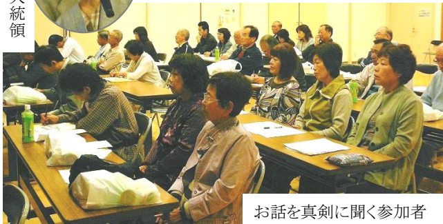
お話を真剣に聞く参加者