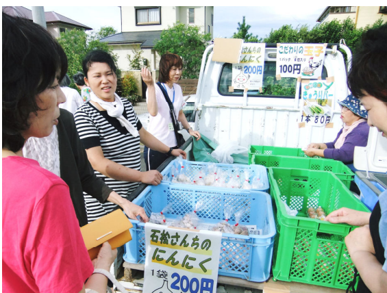
お店の人との会話も楽しい軽トラ市

地域づくり部会では、11月に も軽トラ市の開催を予定してい ます。（地域づくり部会 井上