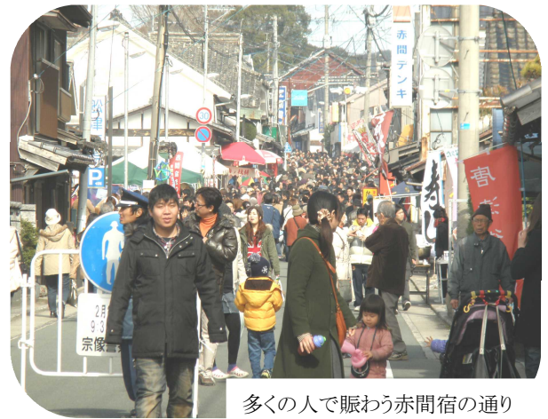
多くの人で賑わう赤間宿の通り

赤間宿まつりが勝屋酒蔵の蔵開きに合わせ て赤間地区コミュニティの主催で開催され ました。