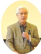
広陵台5丁目区 (松熊区長)

2月13日(日)、第3回自治会活動発表会が開催され、今年も、広陵台5丁目区と陵蔵寺区が報告しました。