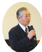
陵蔵寺区 (前田区長)

生した時の祝いから年間を通じて親の交流や青少年育成会を通して活動を進めていることが報告されました。