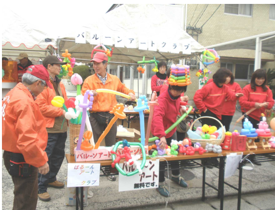
ポップで楽しい子どもコーナー（バルーンアート）