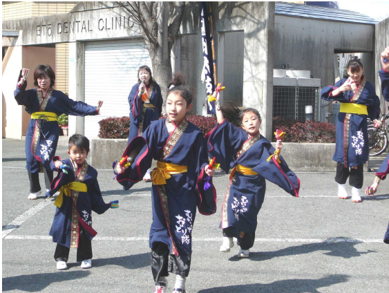
イベント会場で華麗に踊るよさこい踊り