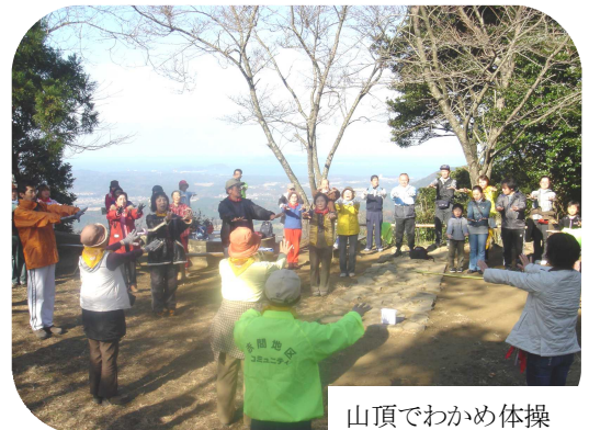
山頂でわかめ体操

12月12日(日)、落葉舞い散る暖かい日差しの中、赤間地区の子どもから高齢者の方まで約90人が参加され、城山ふれあい登山(標高369m)が開催されました。 福岡教育大附属幼稚園前で受付をし、簡単なストレッチ体操を行い、9時30分に出発しました。皆さん、思い思いのペースで、時折、木立の間からのぞき見える赤間地区の風景を楽しみながら山頂を目指しました。急な階段に息をきらせ、赤、黄、色とりどりの落葉を踏みしめ、心地よい汗を流しました。