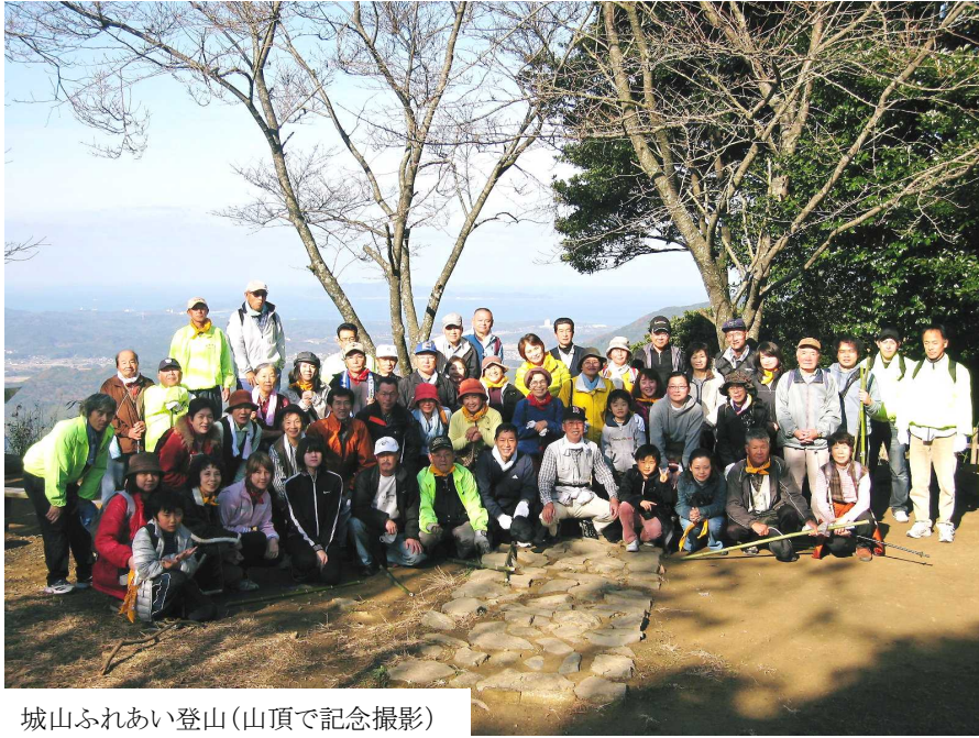
城山ふれあい登山(山頂で記念撮影)

明けまして おめでとうございます 赤間地区のコミュニティ活動も皆様方のお力添えで年々充実したものとなっております。今年も皆様方のご参加とご協力をよろしくお願いたします。 平成23年1月 赤間地区コミュニティ運営協議会