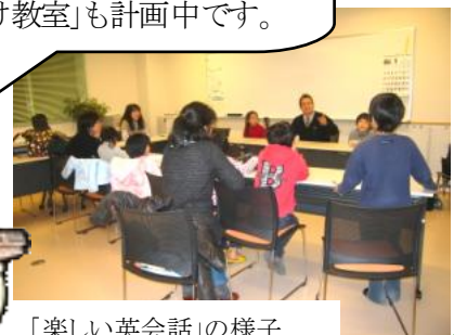
「楽しい英会話」の様子