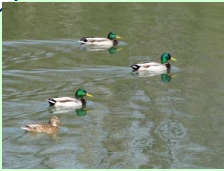
まがも(冬鳥) 撮影場所：広陵台の公園

ピアノの独唱など大人も子どもも楽しめるプログラムでした。祝日の開催とあって、おとうさんの参加もちらほら…。演奏者の「おでかけ音楽隊」のみなさんも豪華な衣装に身をつつみ、小さな子どもたちも家族と一緒にいつもよりちよつとリッチな気分のひとつときでした。