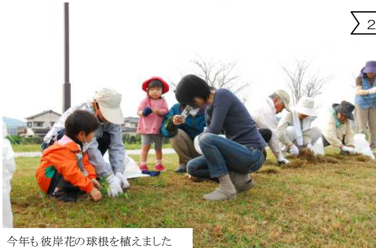
今年も彼岸花の球根を植えました