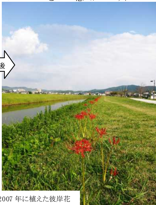
2007年に植えた彼岸花