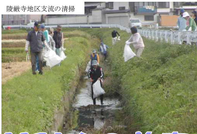
陵厳寺地区支流の清掃

釣川本流、六つの支流で行われた釣川クリーン作戦に1134人の方が参加されました。各自治区からのみなさん、シルバー人材センターの会員さん、城山中学校の生徒、赤間パイレーツの野球少年のみなさんに参加していただきました。2004年に赤間地区コミュニティが始めたときは全体で30人の参加でしたが、こんなに多くのみなさんが参加される事業になりました。