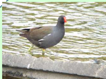
ばん(留鳥) 撮影場所: 徳重・釣川

おしゃれなちらし寿司・ロールキャベツサラダ 花野菜のお吸い物・いちごのチーズケーキ