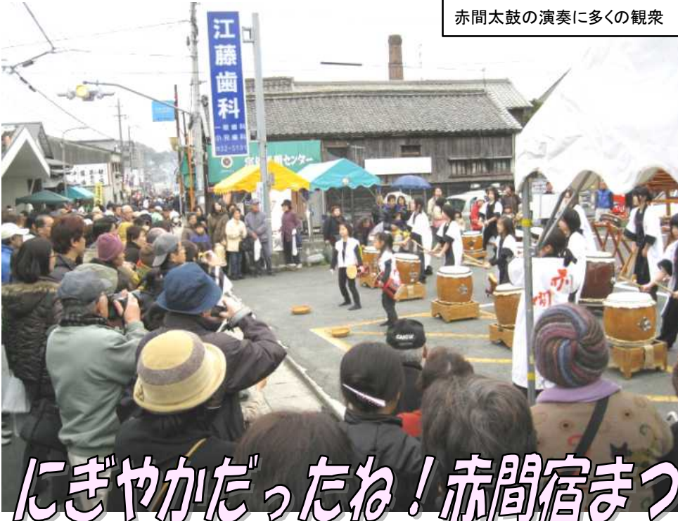
赤間太鼓の演奏に多くの観衆

2月22日（日）、勝屋酒造の蔵開きに合わせて開催された赤間宿まつりには、5千人を超える来場者がありました。当日はあいにくの雨となりましたが、通行止めされ歩行者天国になった赤間街道はにぎやかな一日になりました。