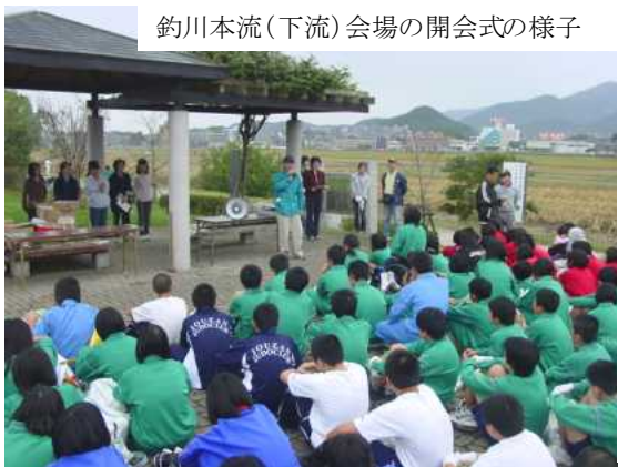
釣川本流(下流)会場の開会式の様子

当日はあいにくの小雨でしたが、赤間地区内の釣川本流・支流の清掃と彼岸花の植栽を行いました。