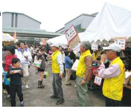
青少年育成部会のお店は大繁盛