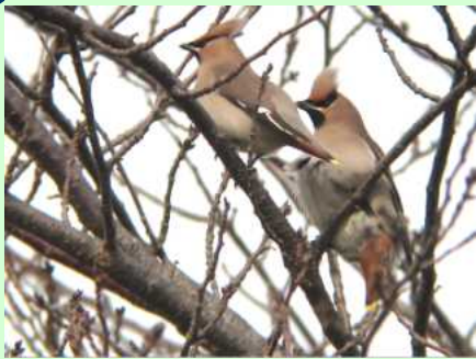
撮影場所…名残集会所の桜の木