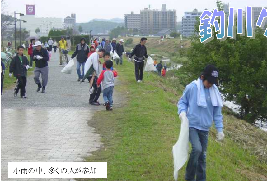
小雨の中、多くの人に参加