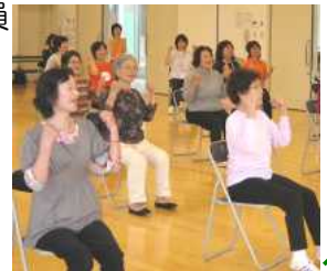
ケアピクスの様子

日 時：12月12日(金) 10:00～12:00 (受付9:30～) 場 所：多目的ホールA・B・C 内 容：ケアピクス・フォークダンス 講 師：ヘルス推進員 参加費：無料 申込み：当日会場で *動きやすい服装で 上靴・タオルを ご持参ください。