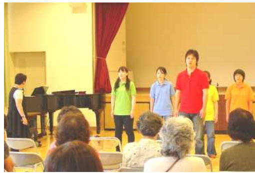
津屋崎少年少女合唱団の合唱

久しぶりに肩に支えていた重たい荷物を降ろせたよ。うなずかすがいい講演会でした。講演のあいま、あいまの合唱団の澄んだ歌声で、外の暑さを忘れさせてもらいました。女性の会、発足にふさわしい意義のある講演会でした。女性の会では、皆さんと問題を共有しながら、地域で女性として何ができるか