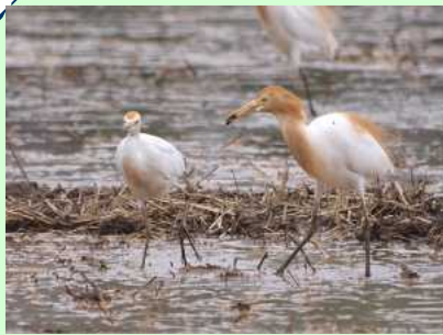
あまさぎ