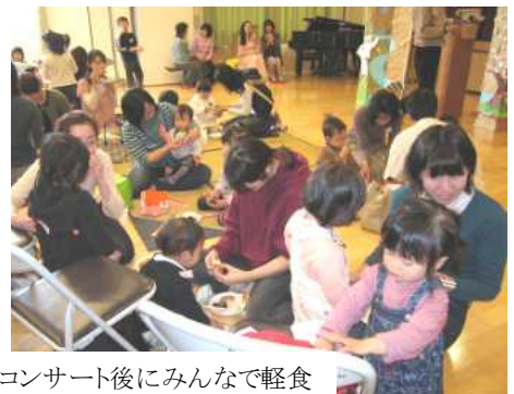
コンサート後にみんなで軽食

最後に、主催者から「来年も楽しくやりますので、たくさん参加してください」と呼びかけがありました。 （青少年育成部会）