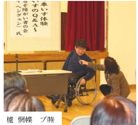
植 惘蝶 プ(特)

小さな段差でも意外に力が要ることを感じた。歩く時には感じなかった坂が意外と動きにくい。