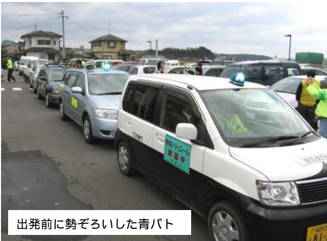
出発前に勢ぞろいした青パト

年末には犯罪が多くなってくるということで、20日の夕方から3ブロックに分かれて早速パトロールを開始。1日おきにパトロールを行いました。地区の皆様、自主防犯に努めるとともに、子ども達を見守ってあげてください。（環境整備部会 村山）