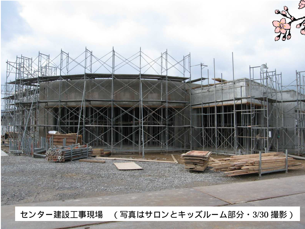
センター建設工事現場 (写真はサロンとキッズルーム部分・3/30 撮影)

「センターはいつ開館するのか」「いつから利用できるのか」という問い合わせがあつている赤間地区コミュニティ・センターは、昨年10月に着工し、今年7月の開館に向けて順調に建設が進んでいます。コミュニティ運営協議会では、センターの開館に合わせて「センター活用推進委員会」と「備品購入検討委員会」を開催し、センター