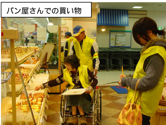
パン屋さんでの買い物

参加者のみなさんも笑いと感動の中で講演を聴きました。「子どもの見方が変わりました」などという感想も聞かれました。