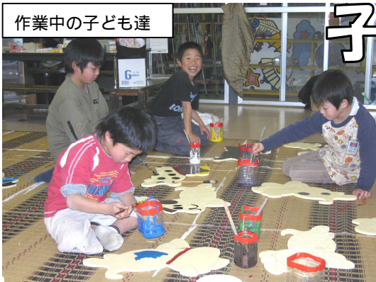
作業中の子ども達