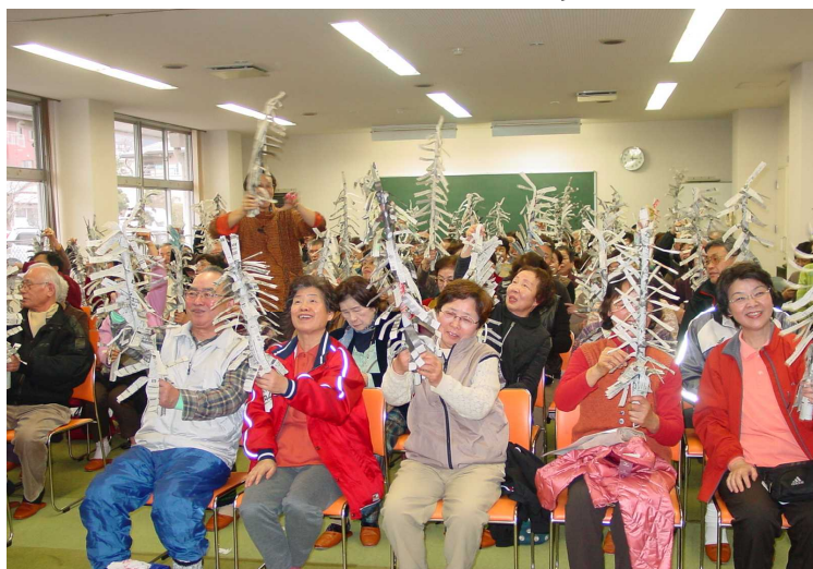
みんなで新聞紙のツリーを作りました。(これも簡単なマジック)