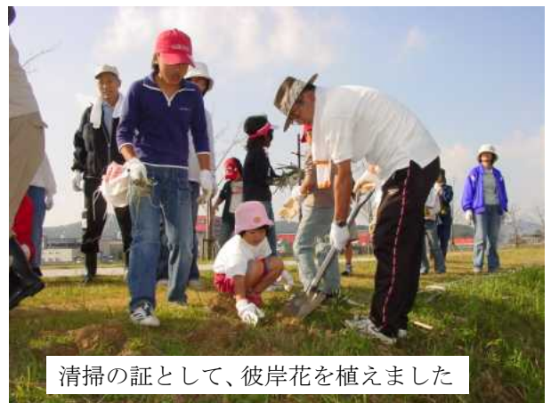
清掃の証として、彼岸花を植えました

齢者、女性の参加が多かったようです。釣川本流には赤間地区の消防団の皆さんが川の中に入りゴミを回収しました。回収したゴミを缶、ビン、可燃物の3種類に分け、軽トラック等で徳重桜公園にまとめました。ゴミは自転車、軽トラ、タイヤ7個、可燃物は軽トラックで7台分程回収しました。今回の釣川清掃活動と彼岸花の植栽が成功したのは、日頃から住民のみなさんがきれいな街にしたいという熱い気持ちがこの釣川清掃活動に結実したものだと感じています。