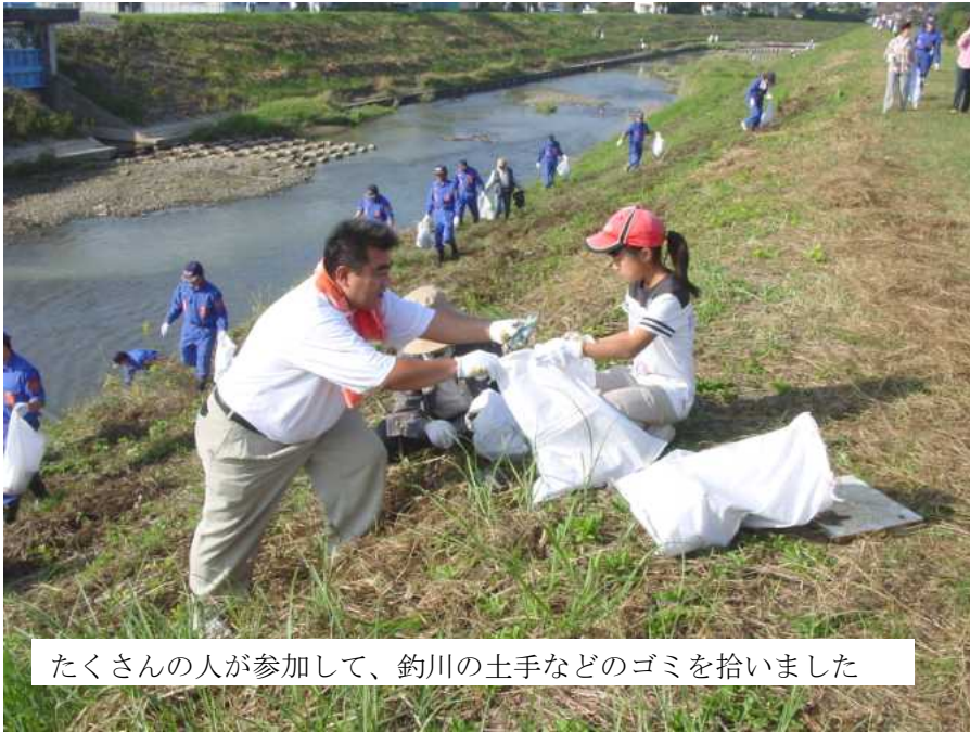
たくさんの方が参加して、釣川の土手などのゴミを拾いました