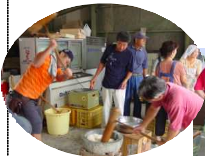
←今年も餅つき大会があるよ!