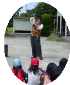
←おどってん祭が街道を練り歩くよ♪