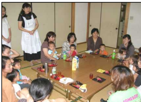
遊んだ後は、楽しいティータイム!

広々としたお部屋で、いろんなおもちゃでたくさんのお友だちと遊べるよ! みなさん、遊びに来てね。 第2回は9月21日です。