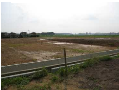
平成18年7月7日の様子

天候等の関係で、来年春の開館予定が少し遅れているようですが、現在は土地の整備が行われ、10月頃から建物の建設に取りかかる予定となっています。