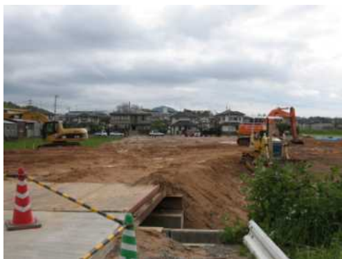
平成18年4月12日の様子