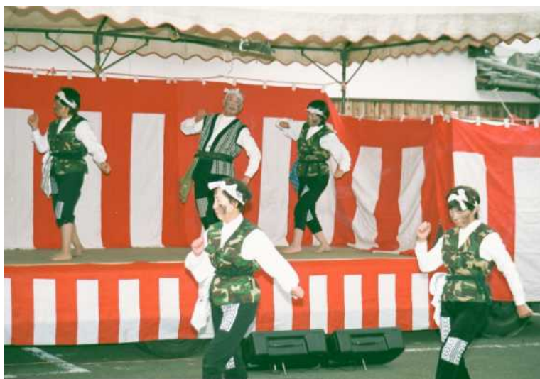
葉山区の方による「炭坑節」がステージ部門の最後をかざりました。