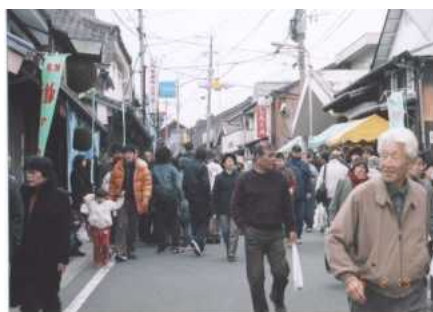
天気にも恵まれ多くの人で賑わいました。

二月十九日(日)に、勝屋酒造の蔵開きに合わせて赤間宿まつりを開催しました。まつりには、陵厳寺区、広陵台一丁目区、葉山区、名残区、徳重区、赤間区等から竹細工や野菜、お米、漬物、おでん、もち煮などの出店や区長会のお店も二時過ぎには完売しました。一方、ステージでは緑町区、葉山区、徳重区、広