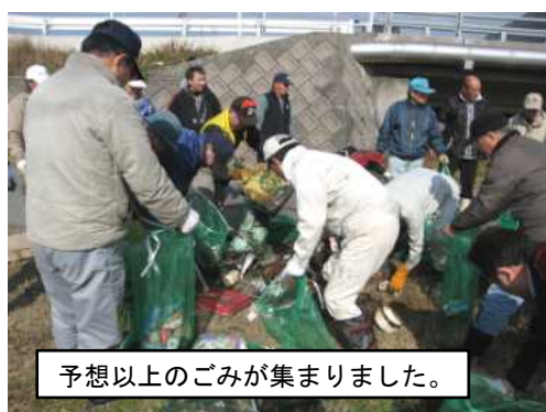
予想以上のごみが集まりました。

部会では、来年度も場所を変えて犬のフン害防止警告看板を設置しようと計画しています。