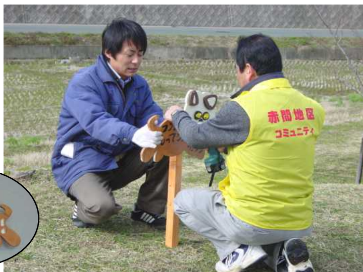
釣川沿いに二十一枚の犬の手作り看板を設置しました。

三月四日(土)晴天のもと、環境整備部会が、釣川沿いの桜づつみ公園にかわいい犬の形をした「犬のフンをもってかえろう!」看板を二十一枚設置しました。二回目釣川支流清掃活動も同時に行い、みんなの手できれいな釣川になりました。