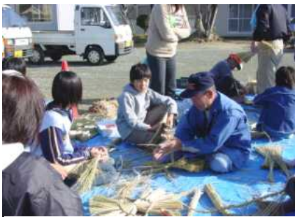
名人は上手ですね

富地原区は、区の行事として毎年年末にしめ縄を作っているそうです。十二月三日は、絶好のお天気で青空の下、しめ縄作りが行われました。二十二人の子どもたちも全員参加で、毎年楽しみにしているそうです。きっと良いお正月が迎えられたことでしょう。