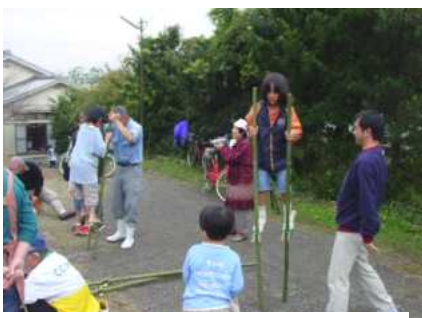
作った竹馬に乗ってみました