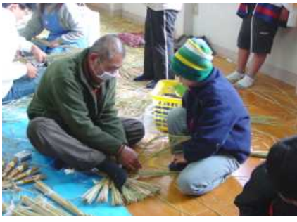
熱心に教わっています

子ども会が中心となつて昨年末の十二月十八日にしめ縄作りに挑戦しました。子どもからおじいちゃんたちまで約六十人が集まつて、公民館内は大賑わい。初めての経験は子どもだけではなく、大人も夢中になつて挑戦し、立派なしめ縄ができました。