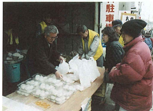
つきたてお餅は大好評! 飛ぶように売れました。