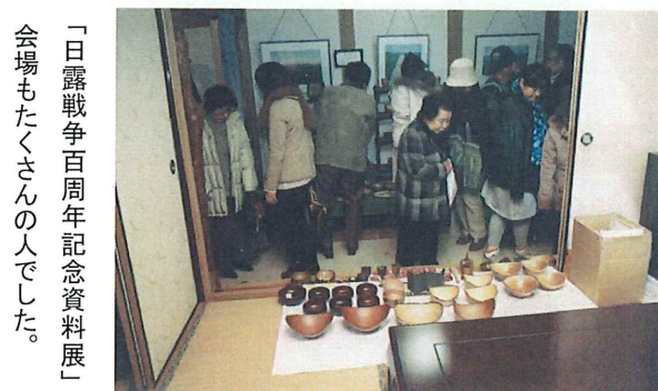
「日露戦争百周年記念資料展」 会場もたくさんの人でした。