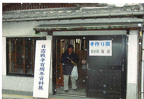
日露戦争百周年記念資料展と手作り展会場

本年も市民の皆様のご協力で、赤間宿まつりも盛況に開催することができました。心からお礼申しあげます。また、スタッフの皆さんのご努力に厚く感謝いたします。お疲れさまでした。