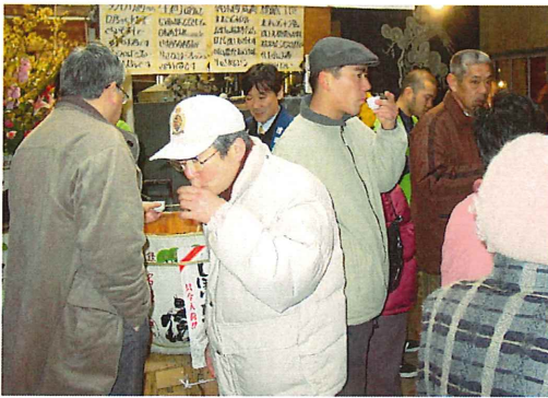
試飲をする人で賑わう勝屋酒造