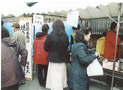
お昼頃、バザー会場は暖かい 食べ物を買う人で賑わいました。