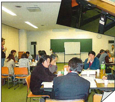
第5回の様子 ソフト面について話し合う。

次に、前回話し合っ、決めた部屋名が書かれた「室名カード」を使って建物内の配置計画（間取り図）案を作成しました。各グループで作成した間取り図を発表しました。