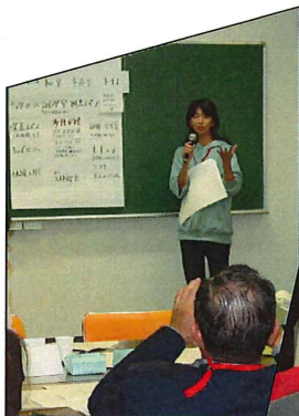
第3回の様子 グループの部屋名案を発表する。