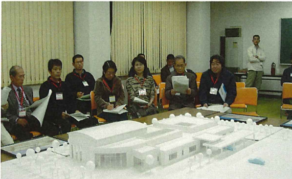
模型を見ながら意見交換

赤間地区では、このコミュニティ活動の本拠であり、地域住民が集い・ふれあい・地域社会を築き上げる拠点としてのコミュニティ